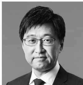
生年月日 1966年11月28日生 当社株式所有数 無し